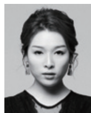
▲ 첼리스트 장우리