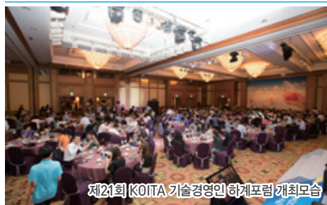
제21회 KOITA 기술경영인 하계포럼 개최모습