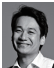
▲ 테너 임상훈