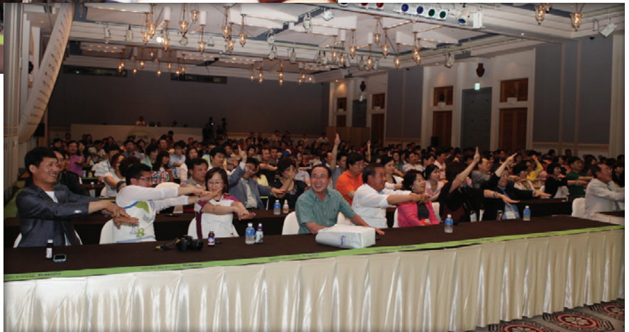
제19회 KOITA 기술경영인 하계포럼 통합강좌 ('12.7.22)