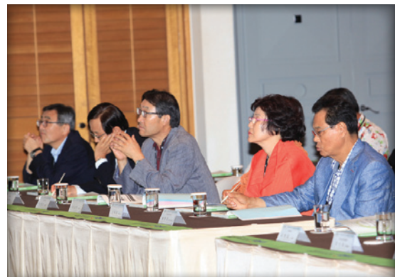
제19회 KOITA 기술경영인 하계포럼 경영강좌 ('12.7.20)