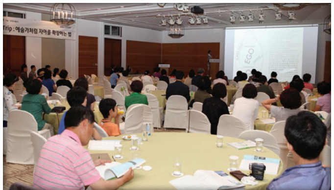
제19회 KOITA 기술경영인 하계포럼 문화강좌 ('12.7.21)