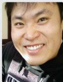
강 플 만화가