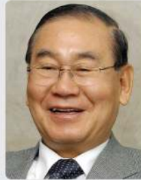
김진현 대한민국역사박물관 건립위원회 위원장