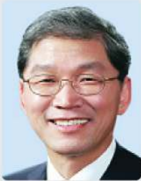
김도연 국가과학기술위원회 위원장