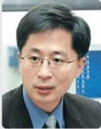
송재용 서울대학교 교수